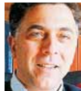
ΤΟΥ ΠΑΝΑΓΙΩΤΗ ΘΑΝΑΣΑ

Το κείμενο των 58 για την ανασυγκρότηση της Κεντροαριστεράς τάρaxε τα νερά. Η συζήτηση και οι αντιδράσεις που προκάλεσε αποτελούν ασφαλή δείκτη της σημασίας του ως δύναμη καταλύτη στην ανασύνθεση του πολιτικού τοπίου. Η αξιωματική αντιπολίτευση π.χ. αντέδρασε με μια αμφικανία που είναι πλήρως κατανοητή: Προσπικτικά, όταν η πολιτική ζωή θα έχει απεγκλωβιστεί από το δίπολο «Μνημόνιο - Αντιμνημόνιο» και η ευρωπαϊκή προοπτική της χώρας θα έχει οριστικά διασφαλιστεί, θα φανεί ότι αποδέκτες του αιτήματος ανασυγκρότησης είναι και πολλές δυνάμεις που σήμερα βρίσκονται εγκλωβισμένες